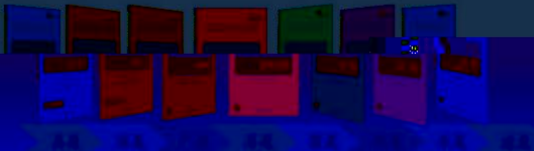
车削 铣削 加工中心 磨削 刨削 冲压 铸造 锻压